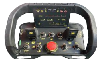
Radio console by AUTEK Console radio by AUTEK